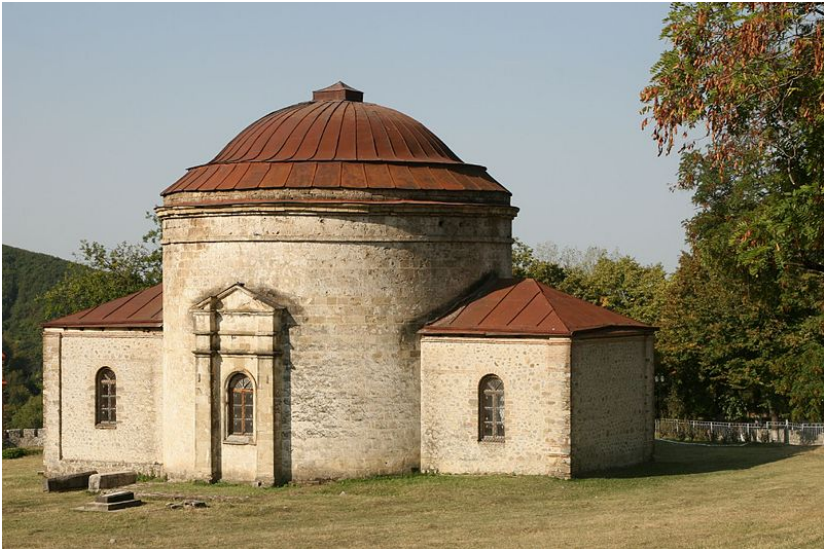
یک نمونه کلیسای آرنی

از آن پس رهبر کلیسای آران لقب «جائلیق» داشت لذا مقر جائلیقی آران تحت حمایت کلیسای ارمنی و جائلیق کل ارمنستان تشکیل شده در نتیجه لقب «جائلیق آرنی، لپنیانس و چوغا» بکار رفت. نخستین جائلیق کلیسای آران آباس (۵۹۶-۵۵۲) نام داشت. و شهر پارتاو یا بردع یا بردعه مرکز کلیسای آران گردید. از سال ۶۰۹ به بعد که کلیسای گرجستان از وضعیت استقلال کلیسایی صرف نظر کرد و به کلیسای بیزانس متشبث گردید، حوزه‌های اسقفی آران (پارتاو، چوغا، کاپاغاک، آماراس، هاشو، تاغزانک، وانک مزاران، وانک کلخو، ساغیان، شاک‌ی یا شکی و غیره) جائلیقی آران را تشکیل دادند که مقر تابستانی آن قلعه بردتاکور بود.