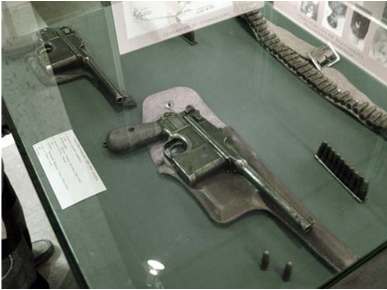
Առաջին հանրապետության զենքը Սարդարապատի թանգարանում