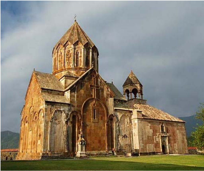
وانک گانزاسار در آرتساخ(قراباغ)

نخستین اسقف کلیسای آران گریگوریس نام داشت که برای اشاعه مسیحیت از ارمنستان به آران رفته بود لیکن او در سال ۳۳۸ به دستور سنتروک پادشاه اشکانی ماساژتها کشته می شود و در آماراس به خاک سپرده می شود. با این حال مسیحیت در آران گسترش می یابد و به مذهب رسمی تبدیل می گردد.