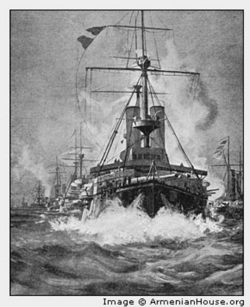
[caption] BRITISH FLOTILLA. The gigantic gunboats of the British Mediterranean fleet nearing Constantinople after the most terrible massacres