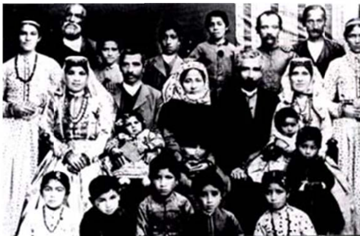
Իրանահայ զերդաստան An Armenian-Iranian family خانواده ارمنی ایران

فصلنامه فرهنگی – اجتماعی مطالعات شرق شناسی ، ایرانشناسی و ارمنی شناسی An International Journal of Oriental Studies