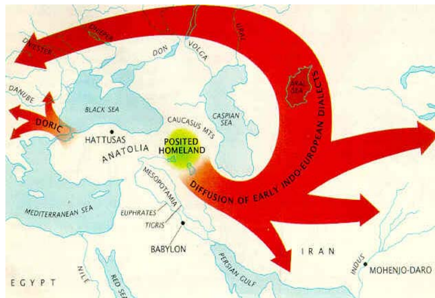
Հնդեւրոպական ցեղի գաղթը Migration of Indo - Europeans مهاجرت اقوام هند و اروپایی

Լայնիրանական մշակութային եւ հասարակական եռամսյա միջազգային հանդես An International Journal of Armenian and Iranian Studies, No. 15-16