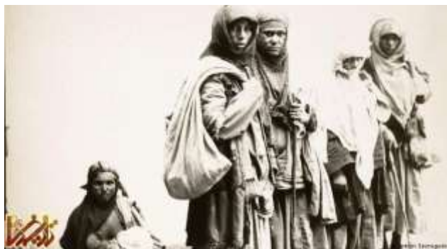
زنان گدا در زمان قاجار