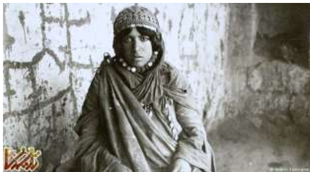
زن ایرانی در عصر قاجار