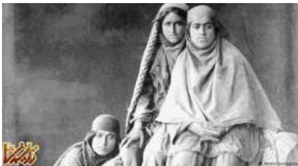
سه دختر از عشایر ایران در اواخر دوران قاجار

با وجودی که آنتوان سوروگین عاشق ایران بود، عکس‌های بیشماری که او از ایران تهیه کرد سرنوشت غم‌انگیزی پیدا کرد. در سال ۱۹۰۸ میلادی آنتوان سوروگین با مشروطه‌طلبان در ارتباط بود. عاملان دربار محمد علی شاه در استودیوی او بمب گذاشتند و حدود پنج هزار نگاتیو شیشه‌ای از آرشیو بزرگ او نابود شد و تنها دو هزار عکس باقی ماند.