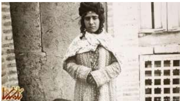
پرتره‌ای از یک دختر ایرانی در زمان قاجار