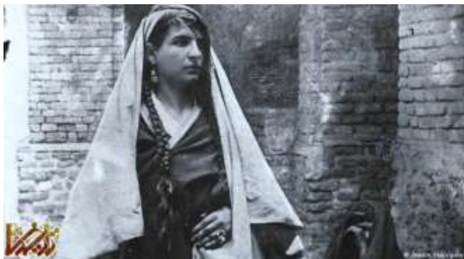
زن ایرانی در عصر قاجار