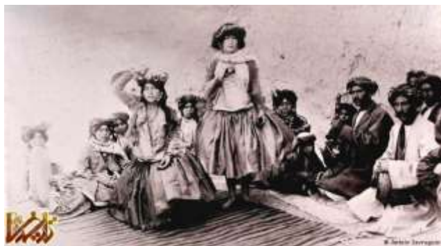
رقاصان و نوازندگان کرد در زمان قاجار