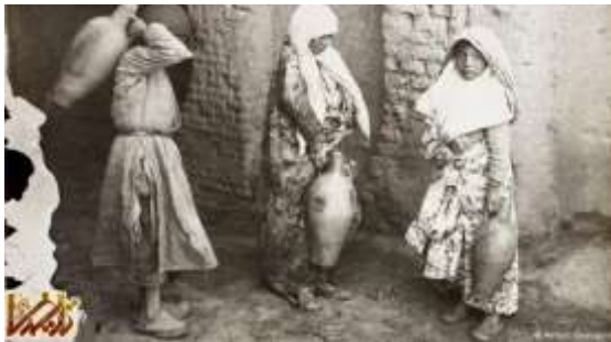
زنان و دخترانی با کوزه‌های آب

آنتوان سوروگین پرکارترین عکاس دوران قاجار و پدر عکاسی اجتماعی ایران است. در سال ۱۹۰۸ میلادی سوروگین با مشروطه‌طلبان در ارتباط بود. عاملان محمدعلی شاه در عکاسخانه او بمب گذاشتند و حدود ۵ هزار نگاتیو شیشه‌ای او نابود شد.