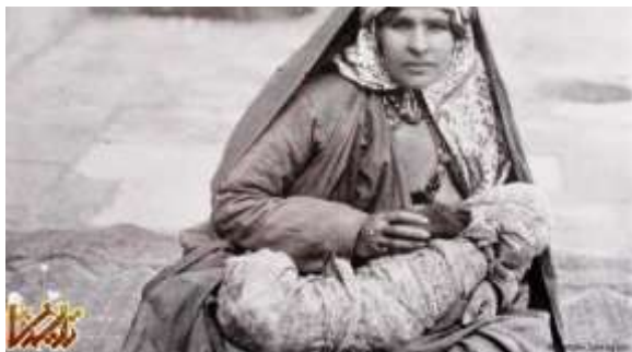
زنی که به کودک خود شیر می‌دهد