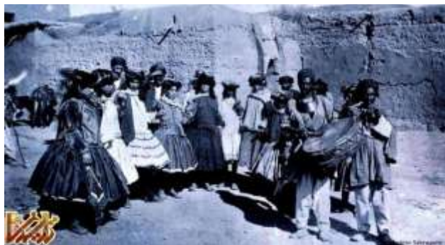
زنان و نوازندگان کرد