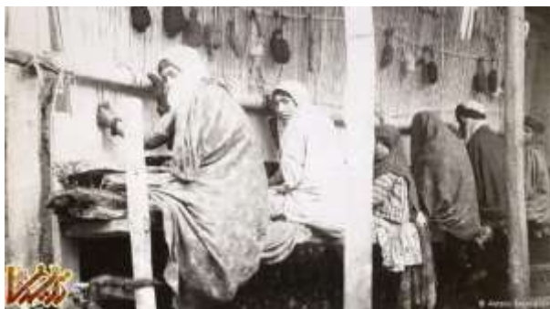
دختران فرش‌باف در زمان قاجار

با وجودی که آنتوان سوروگین عاشق ایران بود، عکس‌های بیشماری که او از ایران تهیه کرد سرنوشت غم‌انگیزی پیدا کرد. در سال ۱۹۰۸ میلادی آنتوان سوروگین با مشروطه‌طلبان در ارتباط بود. عاملان دربار محمد علی شاه در استودیوی او بمب گذاشتند و حدود پنج هزار نگاتیو شیشه‌ای از آرشیو بزرگ او نابود شد و تنها دو هزار عکس باقی ماند.