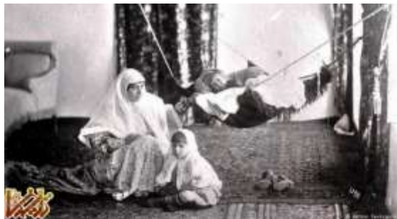
مادر ایرانی با دو فرزند خود • تصویری متعلق به بیش از صد سال پیش آنتوان سوروگین حدود سال ۱۸۷۰ وارد ایران شد. او در ابتدا در تبریز اقامت کرد اما پس از چندی به تهران رفت و در خیابان علاءالدوله (خیابان فردوسی کنونی) یک استودیوی عکاسی باز کرد.