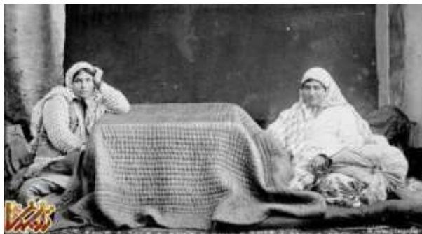
دو زن ایرانی نشسته زیر کرسی در زمان قاجار ناصرالدین شاه علاقه زیادی به عکس‌های آنتوان سوروگین داشت.