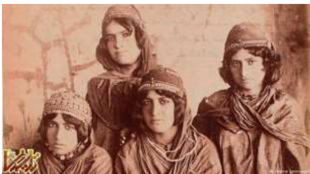
جمعی از دختران عشایر کرد در زمان قاجار