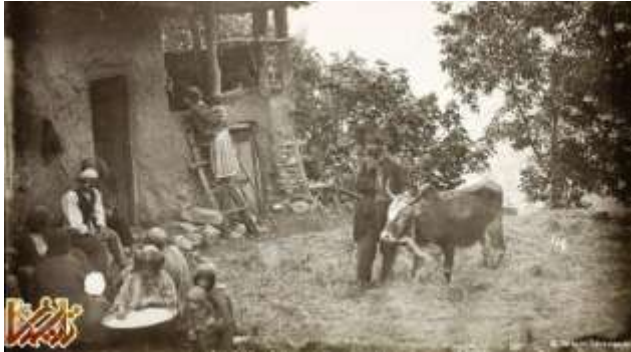
زندگی روستایی در دوران قاجار

پس از چندی به عنوان عکاس باشی مخصوص به دربار ناصرالدین شاه راه یافت اما به عنوان یک هنرمند آگاه تنها در دربار عکاسی نکرد بلکه به میان مردم رفت و عکس‌های بسیاری از مردم کوچه و بازار آن روزگار گرفت.