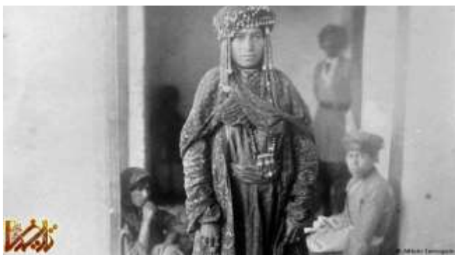
زنان ایرانی در عصر قاجار