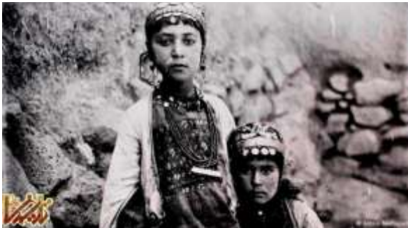
دو دختر از عشایر ایل شاهسون بیش از صد و بیست سال قبل

بیشتر عکس‌های آنتوان سوروگین حدود سال ۱۹۰۰ میلادی گرفته شده است. او توانایی صحبت کردن به زبان فارسی را مانند زبان مادری داشت و به خوبی با اقشار مختلف مردم ایران ارتباط برقرار در آن زمان ارتباط برقرار کرد.