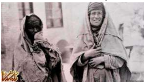
پرتراهی از دو گدا در زمان قاجار