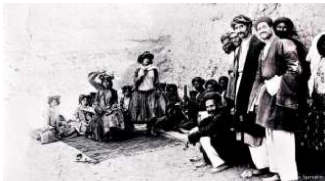
رقاصان و نوازندگان کرد در زمان قاجار