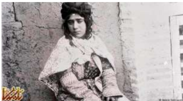
پرتره‌ای از یک دختر ایرانی در زمان قاجار