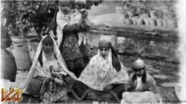
زنان ایرانی در عصر قاجار