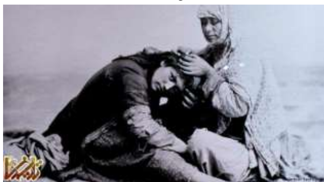
زن ایرانی در عصر قاجار